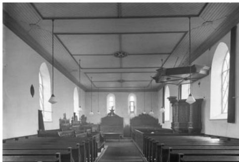
Kerkinterieur in 1941