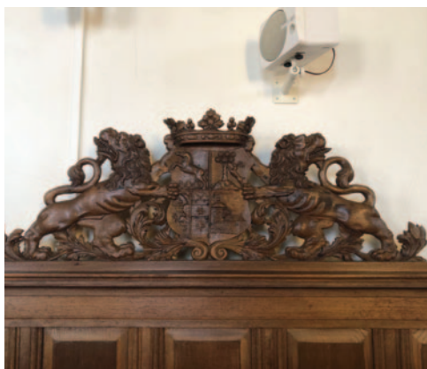
Opzetstuk bank familie Bennema

Wat verder opvalt, zijn de vijf herenbanken waaronder die van bekende families als Clant, Bennema en Geertsema. Ze zijn gemaakt in de 17de en 18de eeuw. Eén bank is 19de-eeuws. Oorspronkelijk stonden er drie tegen de noordwand en twee tegen de oostwand. Bij de restauratie is de indeling gewijzigd en nu staat er nog één tegen de oostwand. Ook het plafond is toen aangepast waarbij de balken weer zichtbaar zijn gemaakt. De banken zijn voorzien van opzetstukken met fraai snijwerk. De familiewapens vertellen wie de eigenaren van de bank waren. De huidige volgorde, van west naar oost is: twee banken van de familie Geertsema, bank familie Bennema en bank de familie Clant. De bank tegen de oostwand stamt uit de 19de eeuw. Van wie die bank was, is onbekend.