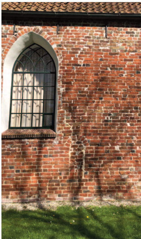
Gedicht laag venster en vergroot (gotisch) hoog venster

restauratie werd aan de binnenzijde de fundering van het hoofdaltaar teruggevonden, evenals de korbogige piscina in een spitsboog nis. Ook werden er aan de oostkant van de oorspronkelijke tweede travee gedichte "ingangen" gevonden. Mij viel op dat deze "ingangen" kleiner waren dan die aan de westkant. Vandaar mijn gedachte dat het wellicht zijvensters of grote knielnissen zijn geweest die zicht boden op twee zijaltaren. In dat beeld past ook dat er tussen schip en koor een doksaal of koorhek heeft gestaan, waarop archeoloog Halbertsma reed hintte. Nader onderzoek is geboden.