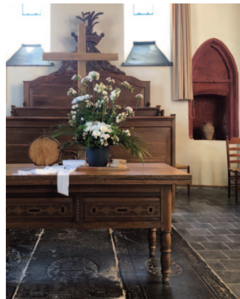
Avondmaalstafel met liturgische (paas) schikking. Rechts de teruggevonden piscina

Na de reformatie nam de avondmaalstafel de functie van het hoofdaltaar over. Met dien verstande dat het Heilig Avondmaal slechts vier keer per jaar werd bediend in tegenstelling tot de eucharistie die iedere zondag plaatsvond. De avondmaalstafel stamt uit het midden van de 17de eeuw. Het is een zware eikenhouten tafel die uitgetrokken kan worden. De tafel heeft diepe laden met sloten. Dit duidt erop dat de tafel eerst een andere functie heeft gehad alvorens een plek te krijgen in de kerk. De avondmaalsbeker is eveneens 17de-eeuws. Tijdens het bezoek stond er een eenvoudig houten