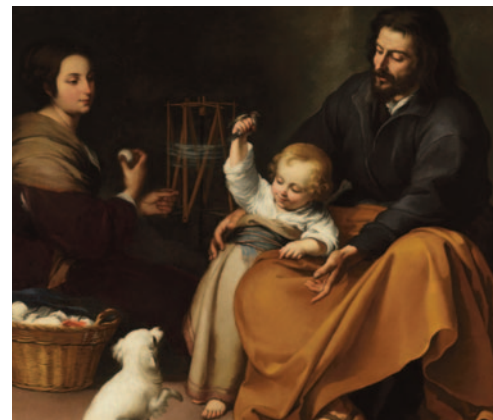
Bartolomé Esteban Murillo, De heilige familie , c. 1650 (olie op doek, 144 x 188 cm.) Madrid, Museo del Prado

Moet het (kern)gezin werkelijk de hoeksteen van de samenleving zijn, zoals diverse christelijke partijen beweren? Een (kern)gezin kan inderdaad goed zijn voor opgroeiende kinderen, maar dat heeft – zoals we hebben gezien – weinig te maken met de Bijbel. Bovendien kan de