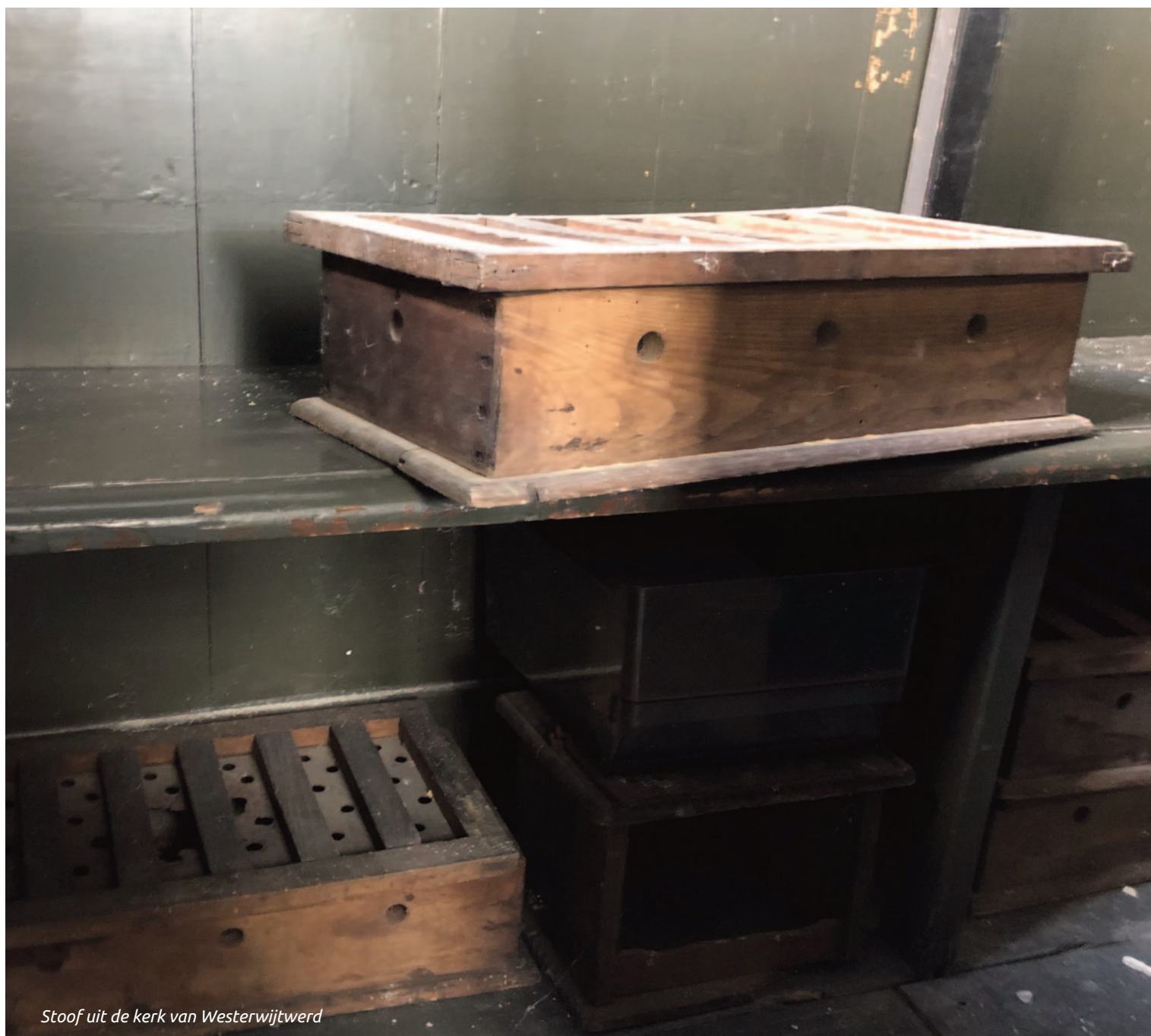
Stoof uit de kerk van Westerwijtwerd