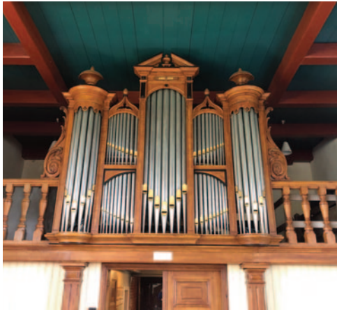
Gezicht op het orgel

Wel is duidelijk dat de kerk is ontstaan binnen het gebied van de oerparochie Oldekerk. Hier- van zijn zowel Zuidhorn als Noordhorn afgesplitst, evenals later Niekerk (en van Niekerk weer Faan).