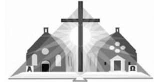
Gereformeerde kerk 't Zandt-Godlinze