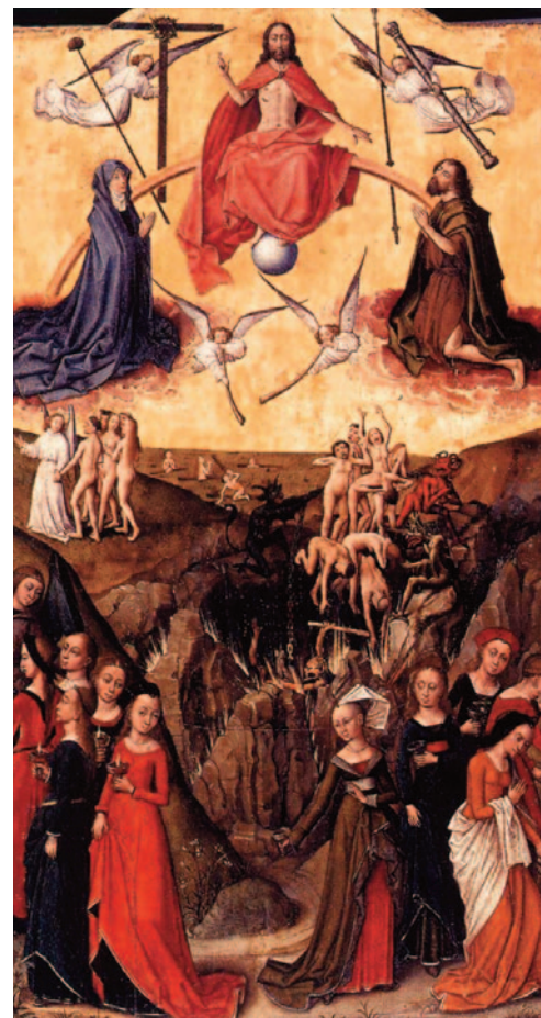
Onbekende Vlaamse meester, Laatste oordeel met wijze en dwaze meisjes, c. 1480, Staatliche Museen, Berlijn