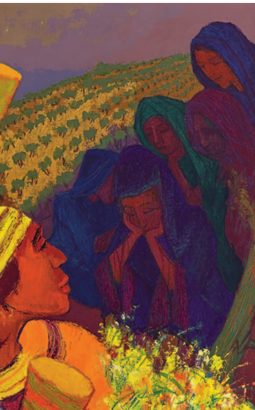
De dwaze meisjes, 1977

haar staf is gebroken. Allemaal tekenen van ongelof. Dit moet en mag niet meer en we moeten afstand nemen van deze uitleg. Tenslotte kunnen we de vraag stellen naar Gods barmhartigheid en of die misschien ook niet kan gelden voor de dwaze meisjes, maar dan stappen we uit de gelijkenis. Jezus vertelt een verhaal en hij doet dat uit liefde voor het leven en in vertrouwen dat God alle mensen het goede gunt. Dat is zijn uitgangspunt. Daarom zijn wij genodigd en overheerst het feestelijke karakter van de gelijkenis.