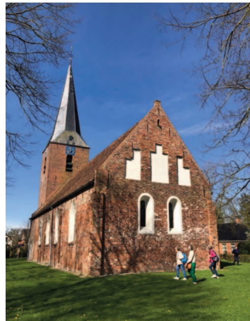
De kerk en westtoren van Noordhorn in 1941 en 2024

Oorspronkelijk had de kerk drie traveeën. Per travee zal er één rondboogvenster zijn geweest. Dit is aan de noordkant nog goed te zien. In het recht gesloten koor waren twee rondboogvensters. Op foto's uit 1941 zien we dat de kerk toen een schilddak aan de oostkant had. Oorspronkelijk zal de kerk gewelven hebben gehad getuige de vondst van de fundamenten van muraalbogen. Mede daarom werd bij de restauratie van 1975-1976 de kap aangepast en de gevel (weer) recht doorgetrokken. Wanneer de gewelven zijn vervangen door een zoldering is onbekend. Waarschijnlijk in de 17de of 18de eeuw zullen de vensters van het schip zijn uitgebroken en kwamen de huidige spitsboogvensters tot stand.