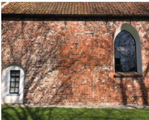
Links de 2e dichtgemaakte zuidingang. Rechts de dichtgemaakte oorspronkelijke zuidingang. Schuin daarboven een vergroot gotisch venster

Verder valt op dat de kerk naar het westen toe is vergroot. In het nieuwe deel werden aan de noord- en zuidzijde nieuwe ingangen gemaakt. Daarbij zullen de oude ingangen zijn gedicht. Tijdens de laatste restauratie werd de "nieuwe" zuidingang dichtgemaakt om een kerkenraads- kamer te maken. Om licht in de kerkenraads- kamer te krijgen werd er een rechthoekig venster ingezet. De huidige entree bevindt zich er tegenover aan de noordzijde.